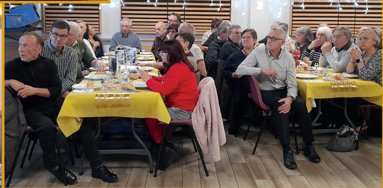
Les danseurs s'en sont donné à cœur joie et les agapes se sont terminées tard.